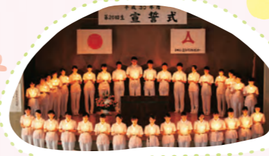
看護を志す者としての自覚を高め「わたしの決意」を述べる式典です。