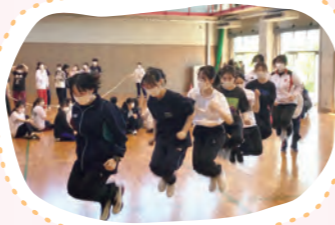
スポーツを通して学生間の親睦を深めます。